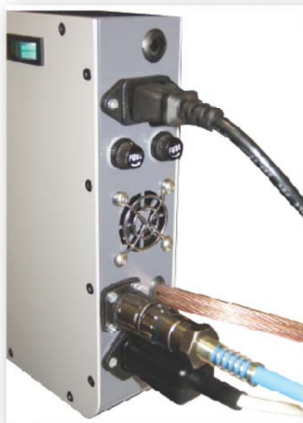
Подсоединение кабелей к генератору импульсов