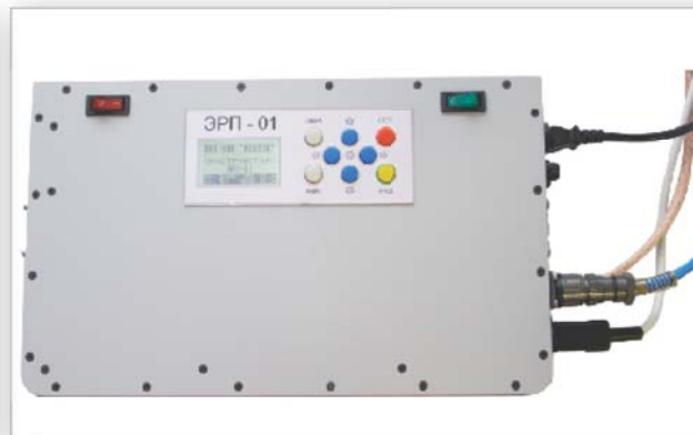
Генератор импульсов (устройство управления)