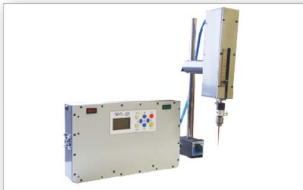
Устройство в сборе без корпуса